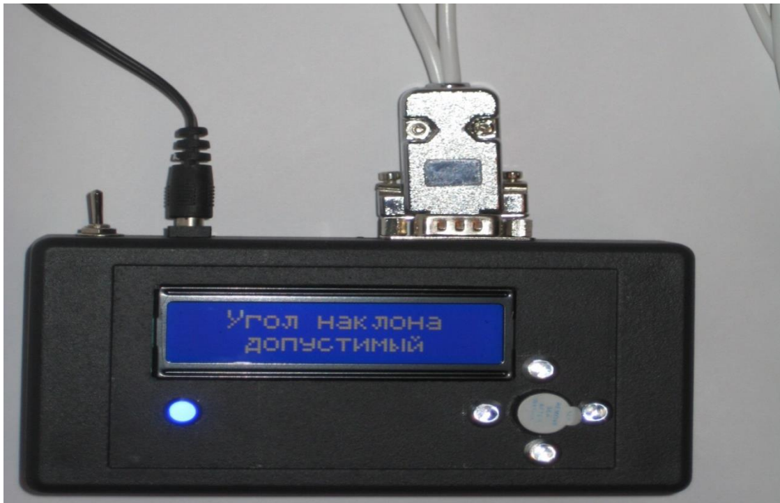
а) робочий стан при допустимому куті нахилу