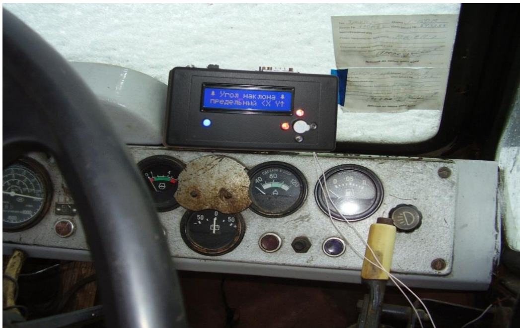
Полеві випробування приладу ПЗФ-2К на тракторі типу Т-150К при виконанні технологічних операцій працюючи на ухилах