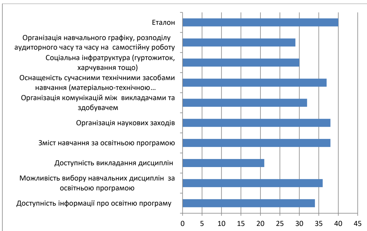
Рис. 1 Сумарна бальна оцінка

Недостатньо високі бали окрім останнього отримав ще показник організація навчального графіку, розподілу аудиторного часу та часу на самостійну роботу. Такі результати можуть пояснюватися деякою суб'єктивністю отриманих результатів, оскільки вибірка складала усього дев'ять осіб з яких лише два здобувачі освіти. Та все ж слід звернути увагу на ці показники при вдосконаленні ОНП.