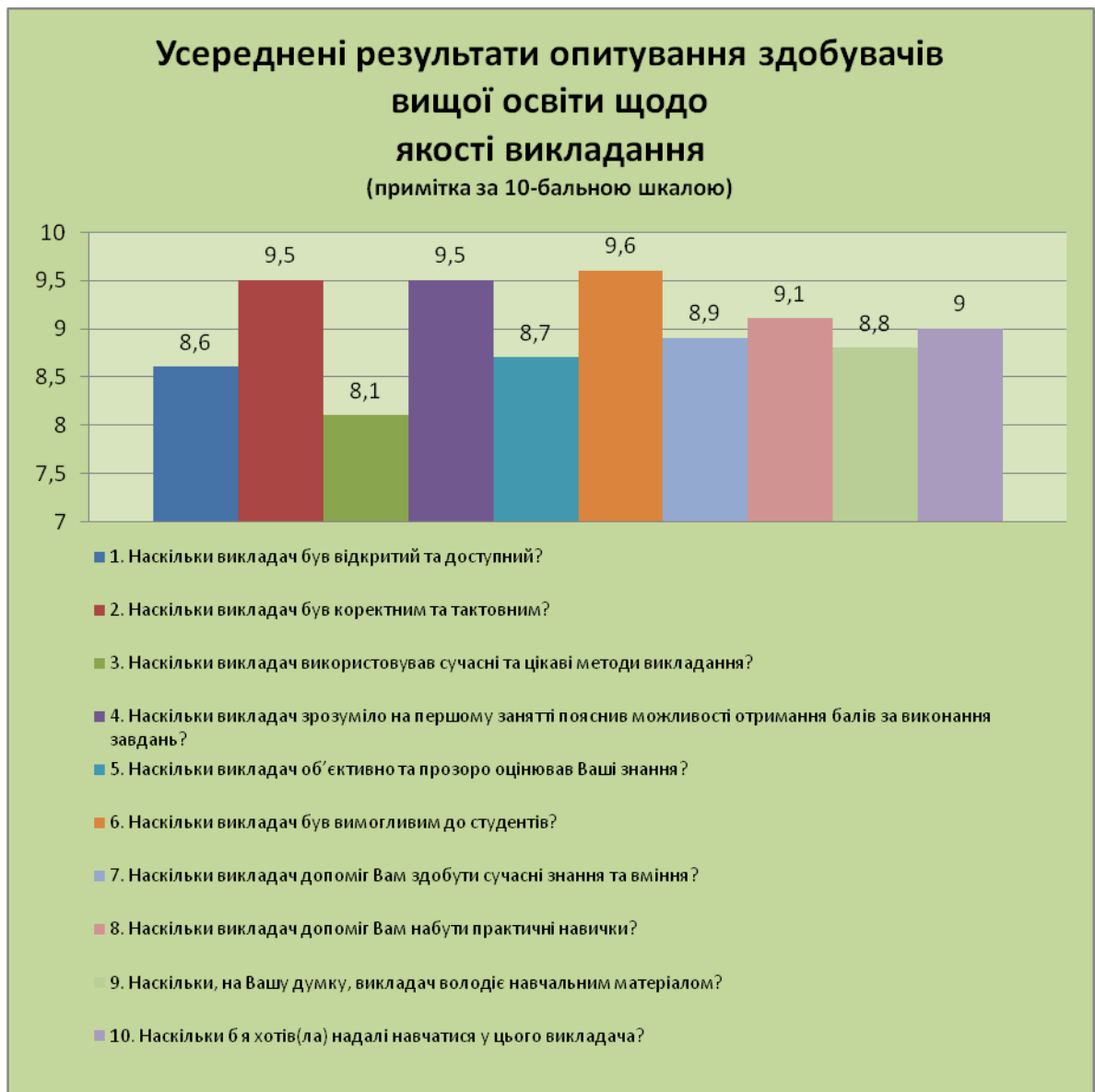
Рис. 1 – Оцінка якості викладання.

Опрацювання результатів анкетування стосовно рівня академічної доброчесності показав (див. рис. 2), що 91% опитуваних знайомі з поняттям «академічна доброчесність», та нормативними документами, що передбачають санкції за недотримання академічної доброчесності. При цьому існують поодинокі випадки (20%) прояву недоброчесної поведінки (списування), що пояснюється недостатньою привабливістю письмової форми роботи. На контрольне питання «Чи поважав університет академічну доброчесність та пильнував академічне шахрайство?» з градацією оцінки від 1 до 5, 20% опитуваних відмітило – 3; 60% опитуваних відмітило – 4; 20% опитуваних відмітило - 5, усереднений результат – 4.