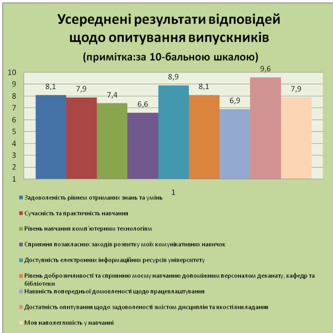
Рис. 3 – Оцінка випускниками якості отриманої освіти

Аналіз результатів анкетного опитування дозволив встановити (див. рис. 3), оцінку випускників показників якості отриманої освіти. Досить високо оцінили доступність електронних інформаційних ресурсів університету та частоту опитувань щодо задоволеності змістом дисциплін та якості навчання, рівнем отриманих знань і умінь, рівень доброзичливості та сприяння навчанню допоміжним персоналом деканату, кафедр, бібліотек. Недостатньо високі бали отримали показники: сприяння позакласних заходів розвитку комунікативних навичок, наявність попередньої домовленості щодо працевлаштування.