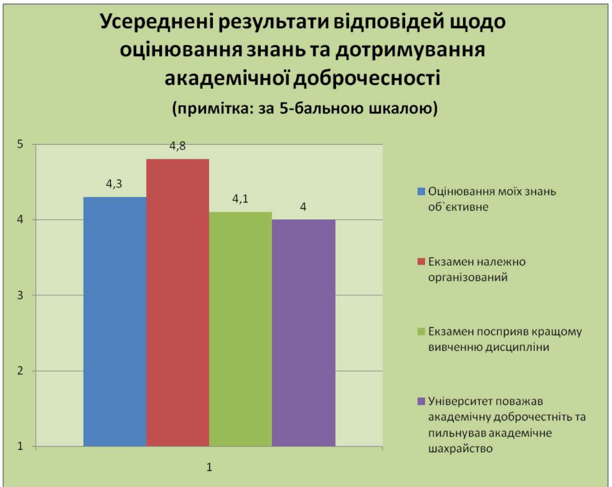
Рис. 2 – Оцінювання знань та дотримання академічної доброчесності.

Середні бали опрацювання результатів анкетування щодо проведення майстер-класу наступні: в цілому робота майстер-класу – 2,7; зміст матеріалу – 3, методика проведення майстер-класу – 3, робота ведучих майстер-класу – 3 (максимальна оцінка – 3 бали). Висока оцінка зумовлена професіоналізмом представника УкрНДІЛГА (ведучого майстер-класу) та зацікавленості здобувачів отримати актуальну інформацію та здобути практичні навички.