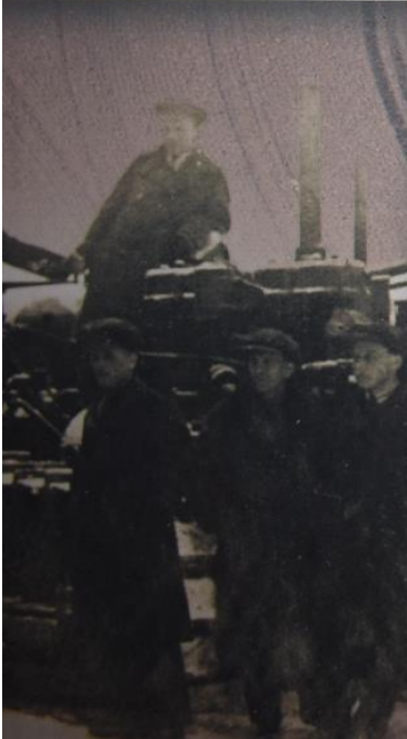
Харківські машинно-тракторні майстерні, передані інституту у 1933 р.