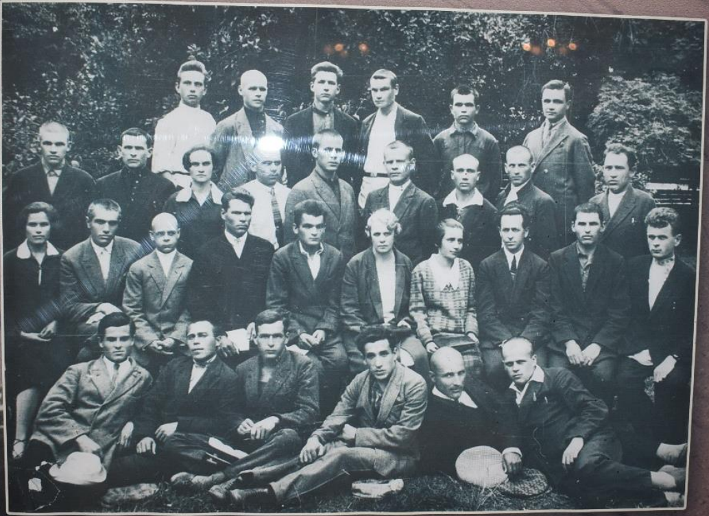
Студенти набору 1930 року, переведені з Полтавського та Харківського сільськогосподарських інститутів