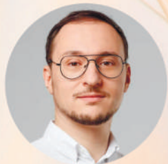
Олексій Рябчин , радник віце-прем'єрки з питань європейської та євроатлантичної інтеграції з EU Green Deal та міністра захисту довкілля і природних ресурсів