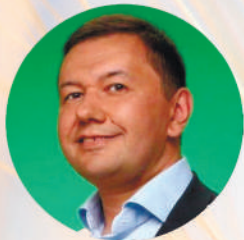
Олег Бондаренко , Голова Комітету Верховної Ради України з питань екологічної політики та природокористування

Сесія 1. Державна екотрансформаційна політика. Як Green Deal вплине на агросферу: шлях сталого розвитку 10.00 – 10.30 ДО ДИСКУСІЙ ЗАПРОШЕНО: