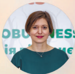
Ірина Ставчук , Заступник Міністра захисту довкілля та природних ресурсів України